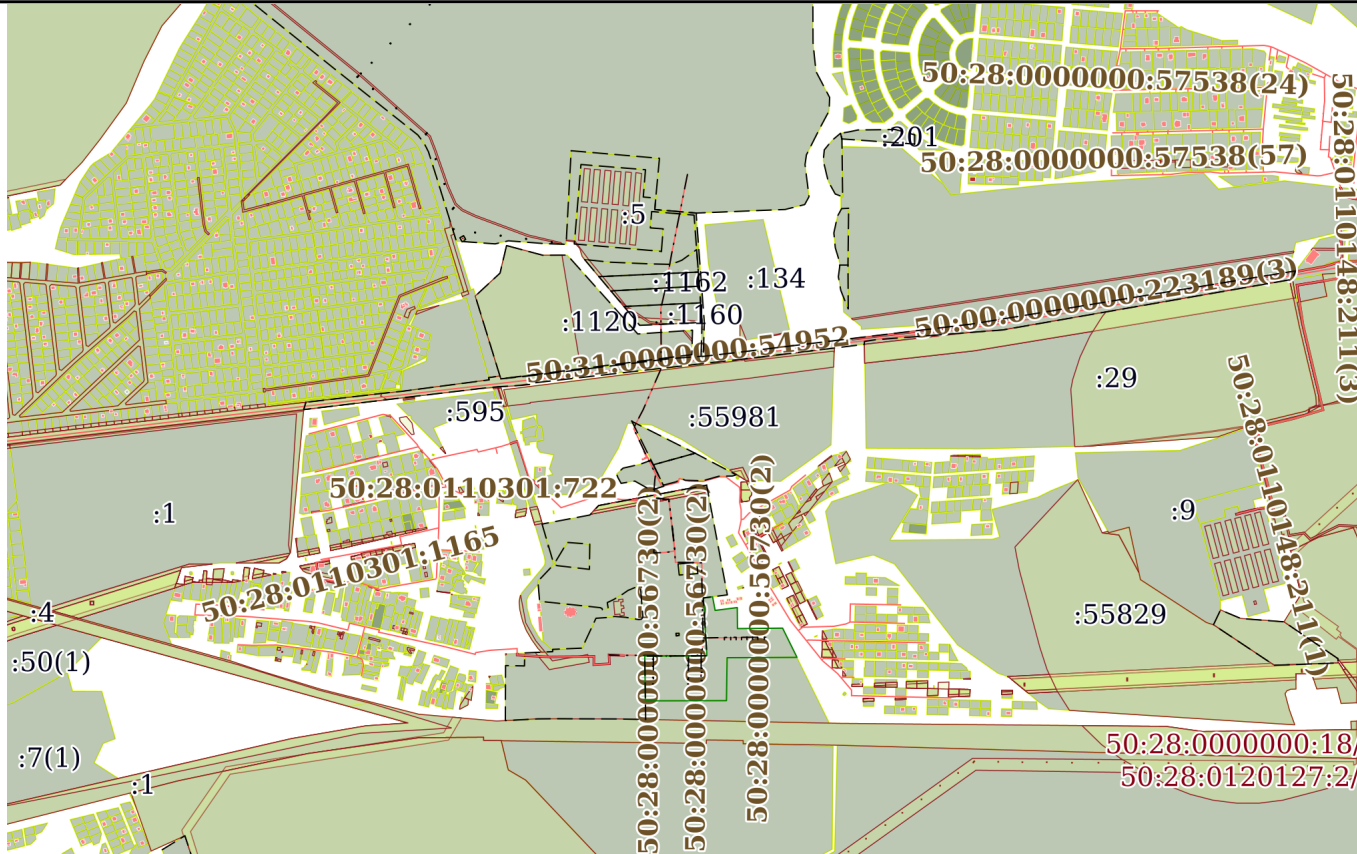
Схема расположения объекта недвижимости (части объекта недвижимости) на земельном участке(ах)